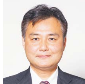
まつした まさはる 松下 正治